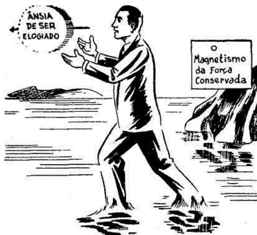
o CHARCO da VAIDADE

força poderosa, à qual demos permissão de atuar contra nós. Quando a maioria dos homens encontra probabilidade de dizer alguma coisa que redunde em seu crédito, não são eles quase irresistivelmente impelidos a dizê-la? Não procuram eles impacientemente a primeira oportunidade para a dizerem? Em cem indivíduos, noventa e nove são assim. Eles não imaginam que esse desejo de elogios é uma das mais poderosas forças artificiais da natureza, e que esse desejo os impele, muitas vezes, contra a sua vontade e sempre contra o seu pensamento ponderado, contra o seu bom senso e o seu bom gosto. E, mais que tudo, eles não imaginam que essa força artificiosa, má, irresistível, é uma corrente mental que poderia ser empregada com imenso proveito para eles, em vez de consentirem que ela se " Descarregue " por um jato repentino, como a centelha elétrica que sai da máquina estática, deixando-os muito mais fracos do que antes.