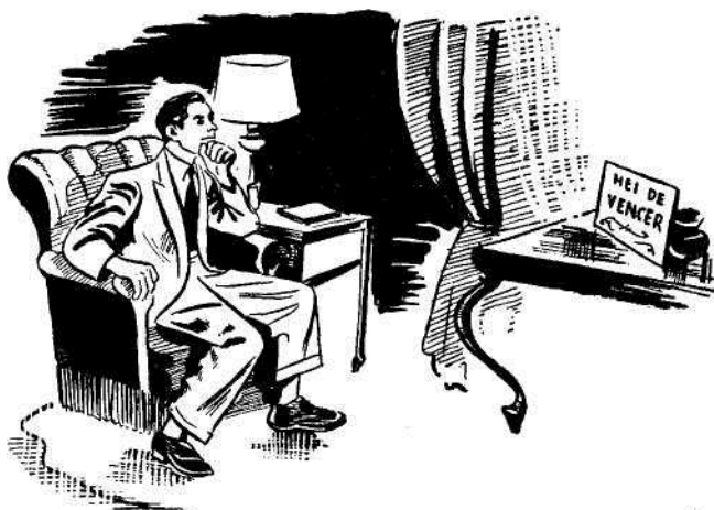
Fotografia mental: formar, absorver e irradiar o força do pensamento.

Tal é a fotografia mental. A teoria consiste em que, desta maneira, as correntes mentais eficientes se formam com maior perfeição. Se começardes por pedidos razoáveis e simples, de natureza genérica, tais como a melhoria gradual da vossa saúde, o aperfeiçoamento e a fortificação do caráter, melhor memória, gênio mais sossegado, provavelmente logo, desde o momento,