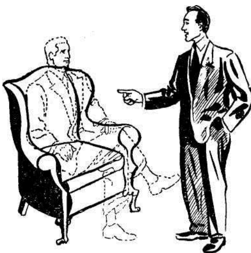
Uma conversa interessante e proveitosa com um "espírito vivo".

Este exercício é magnífico. Desenvolverá a confiança própria em todos os que o realizarem, e os seus resultados serão observados por muitos modos indiretos, que eu não menciono aqui por falta de espaço, mas que vós imediatamente reco-nhecereis.