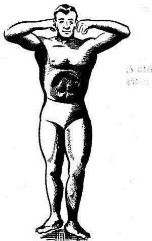
Método muscular ou transformação direta da força física em força psíquica.

Por isto, podeis começar com decisão a "puxar por êle" na conversa, empregando judiciosamente o olhar central. Dedicai todo o vosso tato e ciência a fazer isso de um modo discreto, não importuno, mantendo ao mesmo tempo com firmeza toda a vossa força; por assim dizer, puxando-vos para dentro. Pelo ato de fazerdes passar diante dele as correntes mentais, sob a forma de perguntas ou sugestões hábeis, vós despertais nele correntes simpáticas que manifestam seus gostos e aversões. Estimulando e satisfazendo, no decorrer da conversa, tais gostos e aversões por meio de uma constante subcorrente de aprovação expressa sutilmente, não tardareis a conseguir que êle esteja em completa vibração convosco. Isto é, êle gosta de vós, e prefere estar convosco a não estar. Não cometais o erro de empregar lisonja barata, que só atua sobre os espíritos muito fracos; procurai criar em vós mesmos uma corrente de interesse amável e genuíno. Podeis conseguir isso, expulsando do vosso espírito os outros interesses.