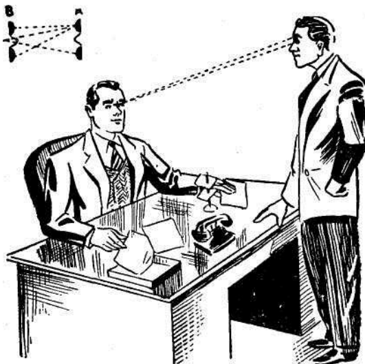
Uma conversa áspera facilitada pelo conhecimento das leis das correntes mentais.

Olhar central. — Quando estiverdes falando, olhai para êle diretamente, para o meio dos olhos , isto é, na raiz do nariz. Imaginai que estais olhando para um pequenino sinal nesse ponto e que estais vendo o ponto fraco do caráter desse homem (porque realmente esses homens grosseiros são mesquinhos e fracos), e, portanto, deveis falar àquele sinal do homem, entre os seus olhos, e olhar com todo o sossego enquanto falais. Nada